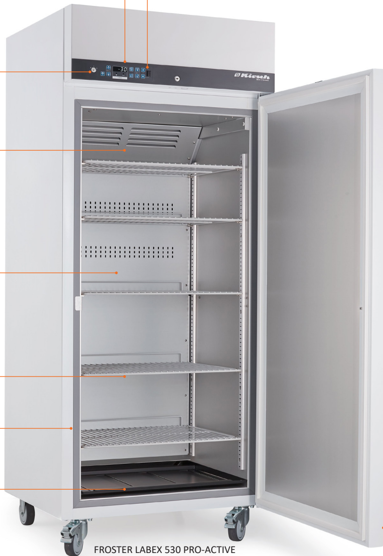
FROSTER LABEX 530 PRO-ACTIVE

Potentialfreier Kontakt/ RJ 45 Buchse bei optionalem PC-KIT-NET